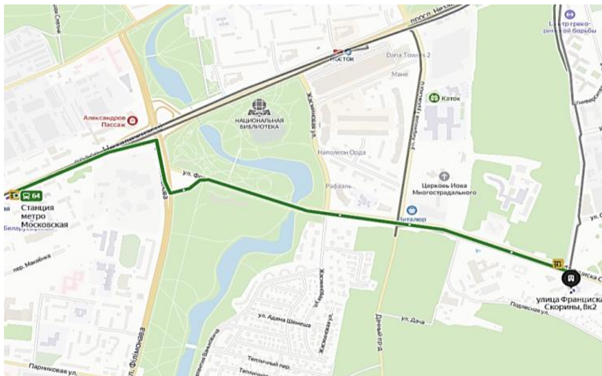
Схема проезда до корпуса 1 – ул. Ф. Скорины, 8/2 Автобусы: 25, 34, 64, 145 от ст. метро Московская

Желаем участникам XXIV Международной научно-технической конференции студентов, магистрантов и аспирантов «Новые информационные технологии в телекоммуникациях и почтовой связи» успешной и плодотворной работы!